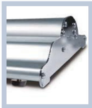
Ein stabiles Gehäuse mit verstellbaren Standfüßen.