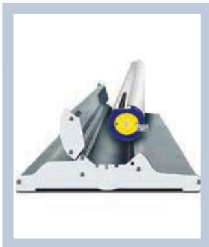
Die Grafik ist im Gehäuseinneren gut geschützt.

Für sein Design hat das Roll Up Classic in Schweden die Auszeichnung „Gebrauchs-Kunst“ erhalten. Das System ist leicht zu transportieren und in Sekunden aufgestellt. Es ist in mehreren Breiten erhältlich und ist sehr strapazierfähig – daher optimal für wiederholten Einsatz am POS.