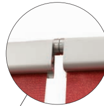
Expand's patentierten Magnetic Connector