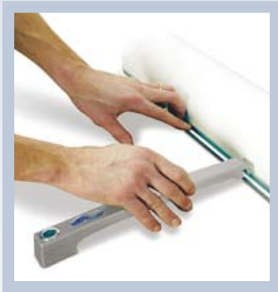
Design – durchdacht bis ins Detail. Systemfuß in das Bodenprofil einhaken.