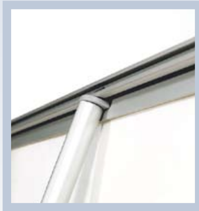
Panelstange in das Topprofil einhaken und fertig.